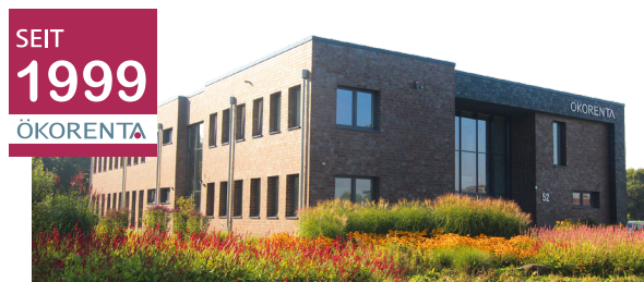
ÖKORENTA-Firmengebäude in Aurich, Ostfriesland

Zum Zeitpunkt der Auflage des Fonds sind weder Vermögensgegenstände erworben, noch stehen konkrete Vermögensgegenstände fest. Sie können sich vor der vertraglichen Bindung an die Fondsgesellschaft insofern kein vollständiges Bild über die Vermögensgegenstände und die damit verbundenen Risiken und Ertragschancen verschaffen. Anleger:innen gehen mit einer Beteiligung eine langfristige Verpflichtung ein - eine Veräußerung an Dritte ist nicht sichergestellt. Für eine vollständige Darstellung der Risiken sollten sie die Risikohinweise im Verkaufsprospekt vom 22. Juli 2022 im Kapitel „Risiken“ lesen. Der Verkaufsprospekt und die „Wesentlichen Anlegerinformationen“ sind kostenlos in elektronischer Form auf unserer Website unter www.oekorenta.de/downloads und in gedruckter Form in deutscher Sprache bei der Auricher Werte GmbH, Kornkamp 52, 26605 Aurich oder bei Ihrem Berater erhältlich.